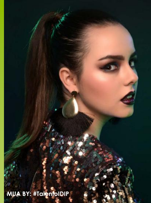
MUA BY: #TalentIDIP