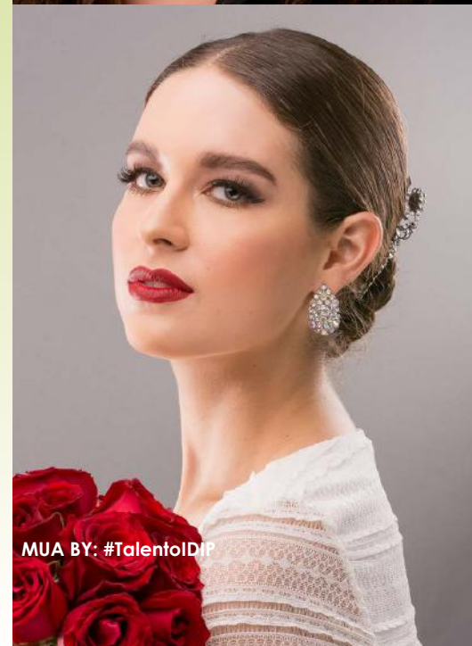
MUA BY: #TalentIDIP