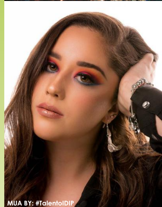
MUA BY: #TalentIDIP