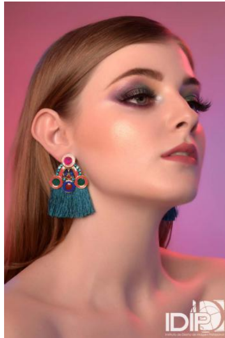
MUA BY: #TalentIDIP