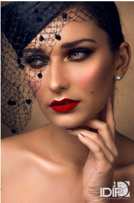
MUA BY: #TalentIDIP